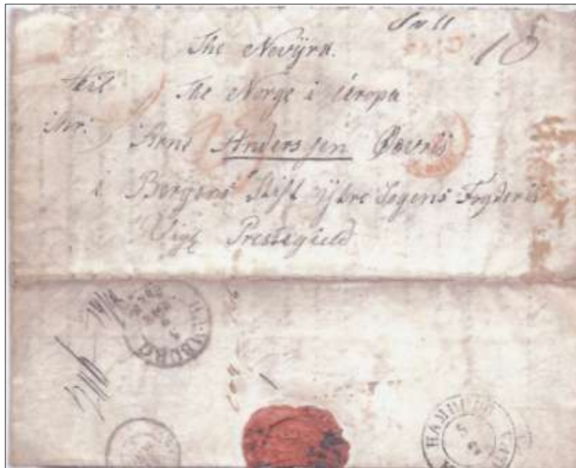
Ill.1. Emigrantbrev til Norge i 1846

Å velge ut et interessant objekt for en artikkel er alltid vanskelig, det finnes jo så mye å skrive om.