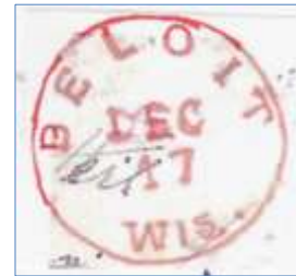
Ill.2.Rekonstruert stempel fra BELOIT

Den lange tiden mellom disse to datoene kan ha naturlige årsaker. Da det forekommer to forskjellige stiler i brevet kan man anta at avsenderen ikke er den som har skrevet hele brevet.