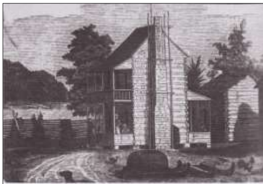
Ill.5. En norsk farmers nye hjem i Nord Amerika

Teksten er ikke lett å tyde, men det virker som det handler om arv og gjeld. Om det er noen som er interessert kan undertegnede skaffe kopier av brevet.